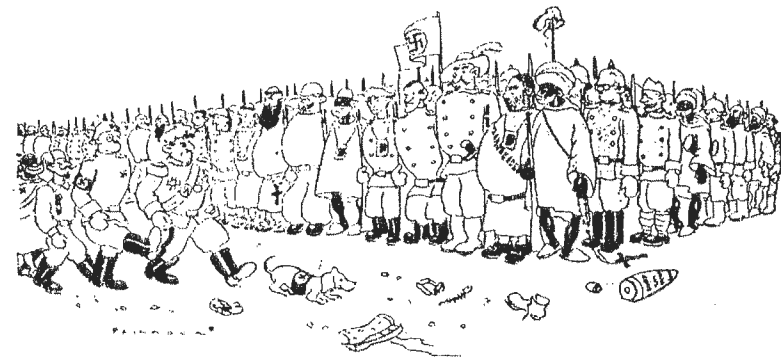
Abb. 2 Francos »Nationale Armee« (Eine Karikatur aus unserer Brigadenzeitung), 1948

Die Kommunikation von Werten, Normen, Selbst- und Fremdbildern, die die politische Arbeit und die Selbsterziehung im Nahhorizont der Bataillonsereignisse im Spanischen Bürgerkrieg ausmacht, wird in einen größeren geschichtlichen Kontext eingebunden. Die Verortung der Kriegshandlungen des Bataillons findet innerhalb einer Tradition des Freiheitskampfes statt, die in Erinnerung an die Revolution von 1848, die Pariser Kommune und schließlich die Russische Revolution von 1917 konstituiert wird. Die Ideologie des Freiheitskampfes in Spanien gewinnt im Fernhorizont seiner Geschichte eine bedeutende Kontinuität. Die Präsenz der aus einer Tradition abgeleiteten Ziele der Volksfront im Spanischen Bürgerkrieg ist für die Sinngebung der gegenwärtigen Handlungen des Bataillons von ausschlaggebender